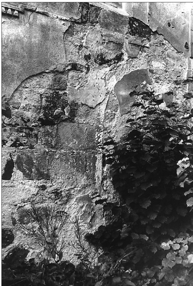
Obr. 3: Drchlava (okres Česká Lípa), kostel sv. Mikuláše. Zazděný románský (?) portál v jižní stěně lodi.

jsou úzkým nástrojem vyznačeny rysky, sledující hrany kvádrů. Stejný charakter má i zdivo západní stěny lodi jižně od věže a zejména na jižní stěně lodi v délce asi 550 cm od západního nároží. Ve vzdálenosti 545 cm od nároží sledujeme levou hranu ostění zaniklého portálu, pokračující neúplně zachovaným půlkruhovým záklenkem. Hloubka pravouhlého ústupku ostění činí 14,5 cm. Dále navazuje nepravidelně odsekaný povrch kamene, nasvědčující, že další část profilace ve zkoumaném místě (patka záklenku) byla při pozdější zazdínce poškozena. Mezi popsáním pozůstatkem půlkruhového portálu a stávajícím obdélným vstupem se dochoval ještě další zazděný pravouhlý otvor, jemuž zevnitř lodi odpovídá prasklina v omítce, opisující hranu segmentem zaklenuté vnitřní špalety. Zřejmě se jednalo o vstup, který nahradil při některé přestavbě původní portál s půlkruhovým záklenkem ostění. V západní stěně lodi na jih od věže za otvorem po vypadlém kvádru zeje ve výši 150 cm nad terénem vodorovná dutina po rozměrném trámu, který snad plnil funkci ztužující armatury. V jižní stěně věže v interiéru prvního patra lze při jihozápadním koutu rozeznat hranu zazděného pravouhlého otvoru, snad drobného portálku.