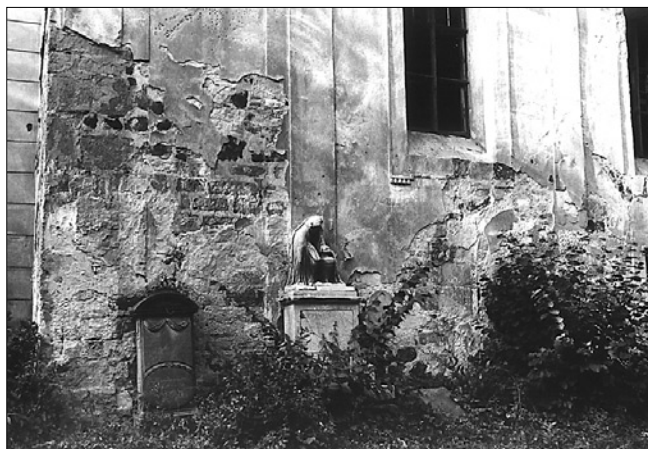
Obr. 1: Drchlava (okres Česká Lípa), kostel sv. Mikuláše. Západní část jižní stěny lodi.

Farní kostel v Drchlavě (okres Česká Lípa) byl v dosavadní literatuře považován za barokní novostavbu. Jedná se o nenáročnou plochostropou stavbu s obdélnou lodí a užším presbyteriem s polygonálním závěrem. Nároží kvádrového zdiva presbyteria zvyrazňují liseny, na severu přiléhá obdélná sakristie. V ose západního průčelí se tyčí věž čtvercového půdorysu s jehlancovou střechou. Okna jsou barokní. Kolem kostela se rozkládá hřbitov oválného půdorysu, vymezený zídou z 19. století.