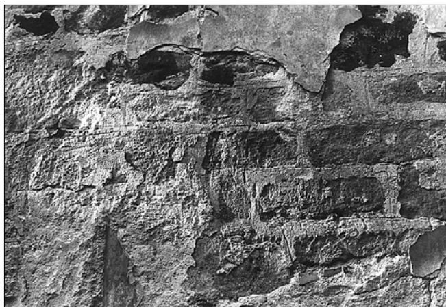
Obr. 4: Drchlava (okres Česká Lípa), kostel sv. Mikuláše. Povrchová úprava zdiva jižní stěny lodi při západním nároží.

Přesnější datace prvotní stavby není možná, protože se zatím nepodařilo najít spolehlivě zařaditelné architektonické články. Nejstarší zjištěnou část kostela - západní polovinu lodi (do zatím neurčené výšky) a přízemí a patro věže považujeme za středověkou, snad pozdně románskou, a to